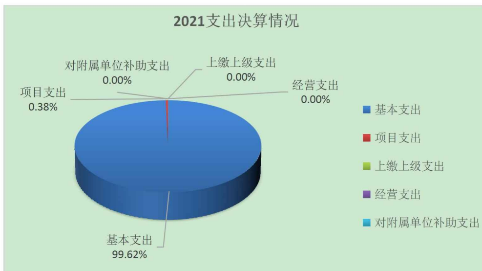
（图 3：支出决算结构图）（饼状图）