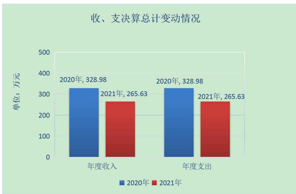
（图 1：收、支决算总计变动情况图）（柱状图）

2021 年度收、支总计 265.63 万元。与 2020 年相比，收、支总计各减少 63.35 万元，下降 19.26%。主要变动原因是项目减少、项目支出减少。