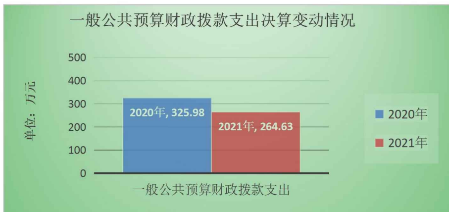
(图5：一般公共预算财政拨款支出决算变动情况)(柱状图)

2021年一般公共预算财政拨款支出264.63万元，占本年支出合计的99.62%。与2020年相比，一般公共预算财政拨款支出减少61.35万元，下降18.82%。主要变动原因是项目减少、项目支出减少。