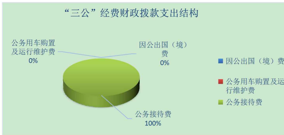
(图 7: “三公”经费财政拨款支出结构) (饼状图)