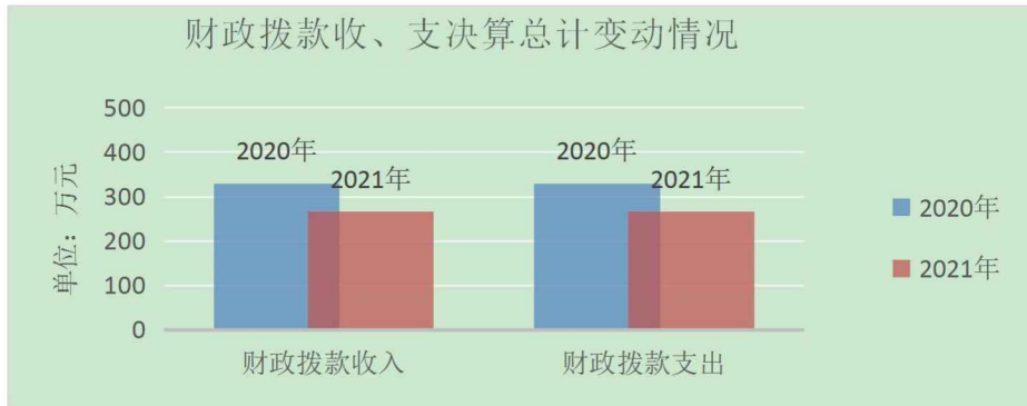
(图4：财政拨款收、支决算总计变动情况)(柱状图)